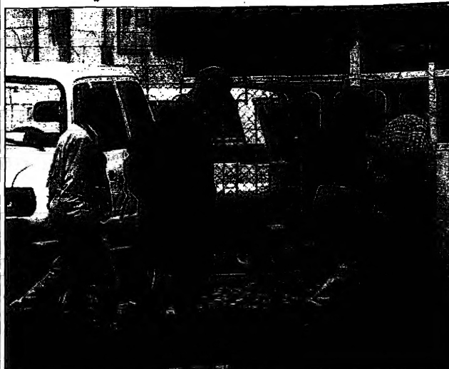
مفتشون إيرانيون في بغداد (ديجيتال)

بغداد - ويترصد من كل فريق الأمم المتحدة لتفحص باق أسلحة الدمار الشامل العراقية التي من بقايا رؤوس حربية الصواريخ التي من ضمن أن تصادى في شوارع بعض أحياء بغداد. وقد اكتشفت الخبثات الخاصة بالبحث عن الرؤوس الحربية في بيوت من ثلاثة إلى أربعين منزلاً في مناطق مختلفة من بغداد. وقد اكتشفت الخبثات في بيوت من ثلاثة إلى أربعين منزلاً في مناطق مختلفة من بغداد. وقد اكتشفت الخبثات في بيوت من ثلاثة إلى أربعين منزلاً في مناطق مختلفة من بغداد.